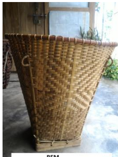
BEM 'TRADITIONAL BASKET'

bem [bem] Noun. traditional winnowing basket; अनाज पछोरने का पारम्परिक टोकरी.