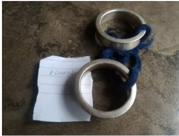
KUARDOJ 'TRADITIONAL MUSICAL INSTRUMENT'

kuardoj [kuardoj] Noun. traditional musical instrument; संगीत के उपकरण.