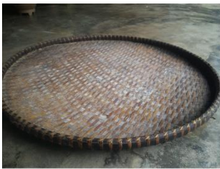
AMERA 'TRADITIONAL WINNOWING FAN'

mera [mera] Noun. winnowing fan; विनोडिंग फैन.