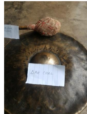
DAR CHAL 'TRADITIONAL MUSICAL INSTRUMENT'

darchal [darʃal] Noun. traditional musical instrument; संगीत के उपकरण.