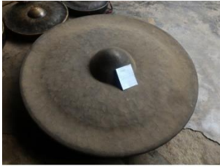
LAMLUANG 'TRADITIONAL MUSICAL INSTRUMENT'

lamluang [lamluan] Noun. traditional musical instrument; संगीत के उपकरण.