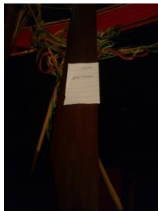
METIAM 'WEAVING TOOL'

metiam [metiam] Noun. weaving tool; बुनाई का उपकरण.