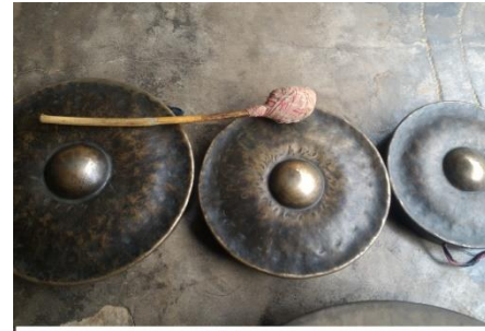
DAR 'TRADITIONAL MUSICAL INSTRUMENT'

dar 2 [dar] Noun. traditional musical instrument; संगीत के उपकरण.