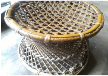
CHOIKHI 'TRADITIONAL STOOL'