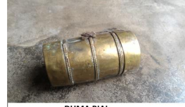
DUMA BIAL "TRADITIONAL ORNAMENT"

dumabial [dumabial] Noun. traditional ornament; पारंपरिक आभूषण.