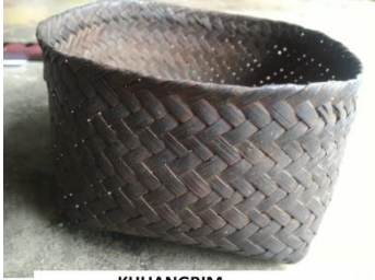
KHUANGBIM 'TRADITIONAL BASKET'

khuangbim [k h uan g bim] Noun. traditional basket; पारंपरिक टोकरी.