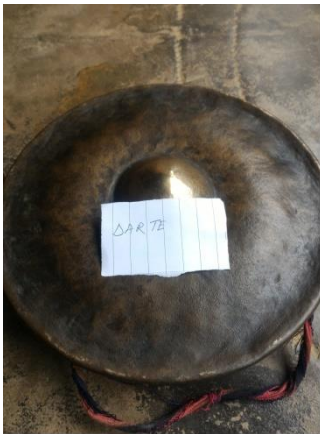
DARTE 'TRADITIONAL MUSICAL INSTRUMENT'

darthe [darthe] Noun. traditional musical instrument; संगीत के उपकरण.