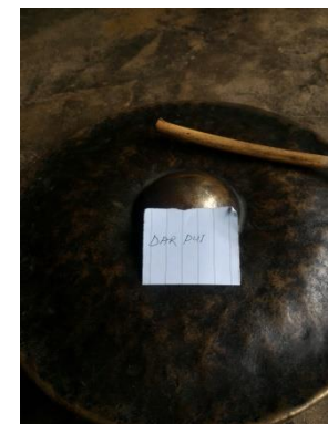
DAR PU 'TRADITIONAL MUSICAL INSTRUMENT'

darpu [darpu] Noun. traditional musical instrument; संगीत के उपकरण.