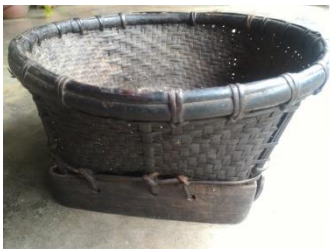
KHAMPHULU 'TRADITIONAL BASKET'