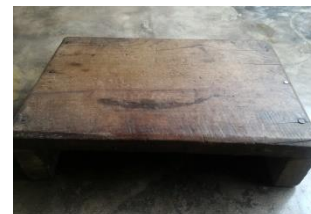
LUKHAM 'TRADITIONAL STOOL'

lukham 2 [luk h am] Noun. traditional stool; मचिया.