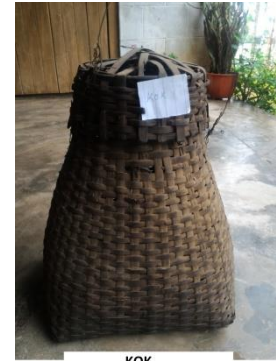
KOK 'TRADITIONAL BASKET'

kok 2 [kok] Noun. traditional basket; पारंपरिक टोकरी.